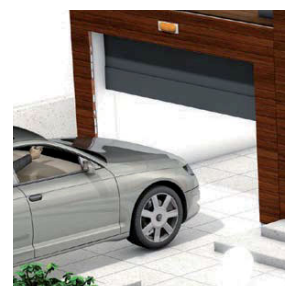
Porte de garage